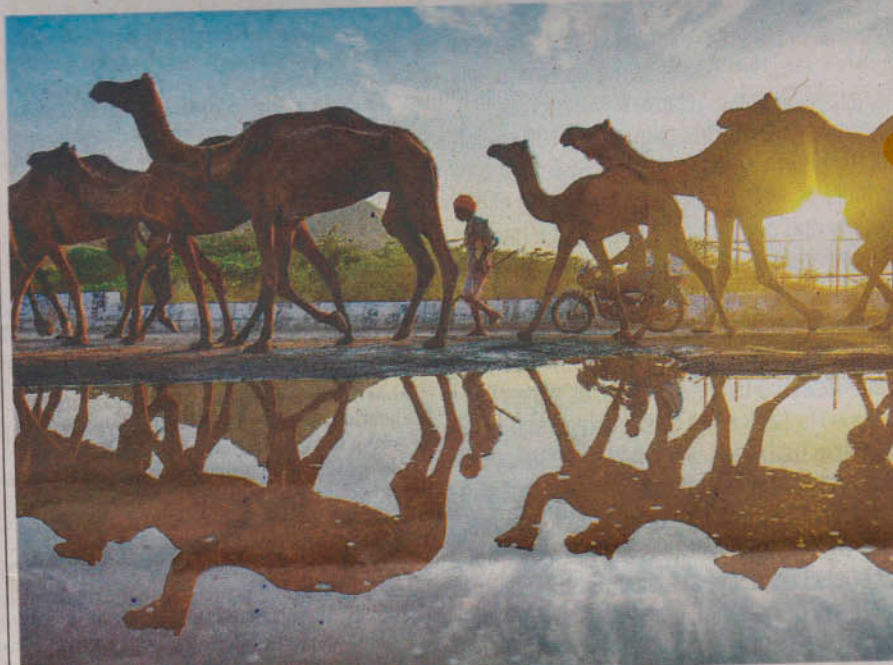
A farmer walks with his camels towards the Pushkar Camel Fair, one of the biggest livestock fairs, in Pushkar on Tuesday

Nirman Cooperative Group Housing Society Limited Place- New Delhi Sd/- Date : 01.11.2019 Hony Secretary